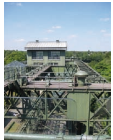
Blick von oben auf die Stahlkonstruktion (Schiffshebewerk)