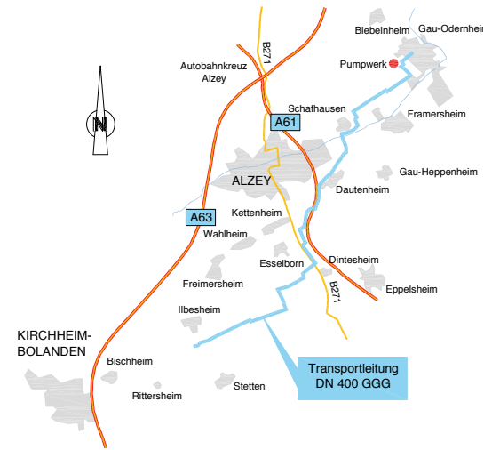
Grafik: WV Bodenheim

Beim Bau des Hochbehälters und der Leitung, die beide in einem sensiblen Landschaftsbereich einem europäischen Vogelschutzgebiet liegen, mussten viele Auflagen beachtet werden. Auch