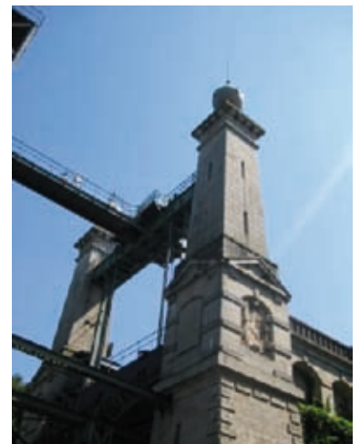
Mächtiges Bauwerk zum Schiffeheben