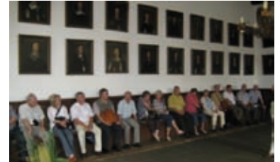
Im großen Ratssaal (Osnabrück)