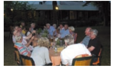
Abendgesellschaft im Parkhotel